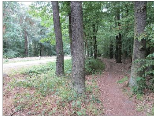
straßennaher Waldweg (Ost)