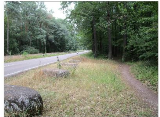
ehemalige Ausfahrt (Zufahrt Tanklager)