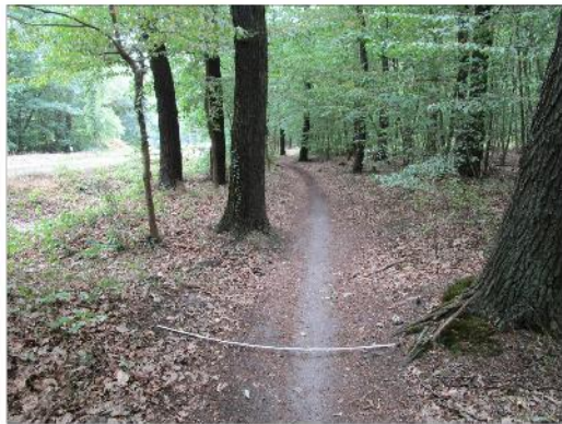
straßennaher Waldweg (Ost)