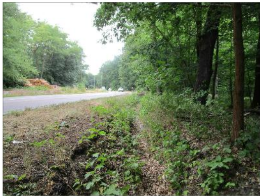
straßennaher Waldweg (Ost)